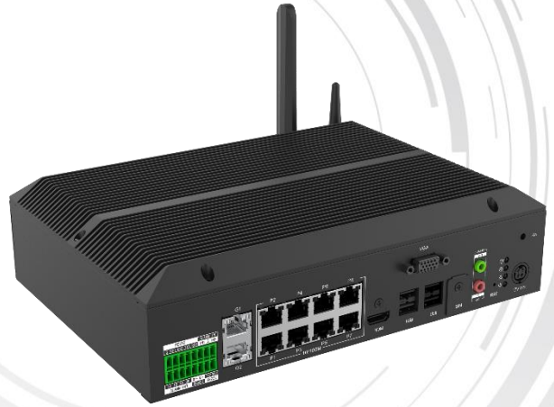
注：产品以实物为准，图片仅供参考

DS-TPE3A0-F系列产品是一款无风扇低功耗高效能嵌入式整机，环境适应性强，运行稳定。用于出入口场景的专用管理终端。支持便捷的网页显示控制，支持本地接显示器和鼠标键盘使用。设备多达10个网口，丰富的IO和串口。丰富灵活的软件配置，实现不同场景应用。完善的数据查询与统计，轻松掌控停车场各项数据。标准接口协议，方便扩展对接。